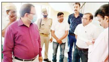
सहारा न्यूज ब्यूरो

दुर्घम के ओपी को पुलिस ने पकड़ा मां ने किया आत्मदाह का प्रयास शुक्लागंज (एसएमजी)। एक गांव निवासी महिला ने गंगाज कोलाबेली में तहरी देते हुए बाबाव कि मां के चेहरे वाले किबने ने नालिम बेटी को शरी का हलाक देकर उसका दुर्घम किया, जिस पर पुलिस ने विधिक के खिलाफ प्रमाण दर्ज किया। इसके साथ ही महिला ने विधिक के पक्षीनी प्रहिलाल को लाइफ डी। पुलिस ने सभी पर अलग-अलग कार्रवाई में मामला दर्ज किया। बाबाव मां का सलाह सलाह मगर, फिर पर पुलिस विधिक को जवाबदार कोलाबेली रह। शुक्रवार रात करीब 11 बजे विधिक की मां बेटीमां ने पुलिस लेक गंगाधर कोलाबेली पहुंची और खुद पर पेट्रोल डिट्रुने ले ली। वह देख कोलाबेली में ज्योतु पुलिस के हाथमय हुए। अगलकन पुलिसकर्मी सड़ और आग लगने से जलते उसे पकड़ लिया, जिसके बाद उसे समझा-बुझाकर घर भेजा। इस बाबत गंगाधर कोलाबेली प्रभारी ने बताया कि मामले को जांचमंडाल का का रहे है।